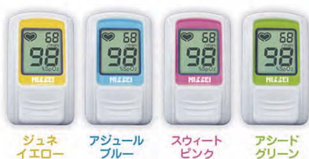
ジュネイエロー アジュールブルー スウィートピンク アシードグリーン