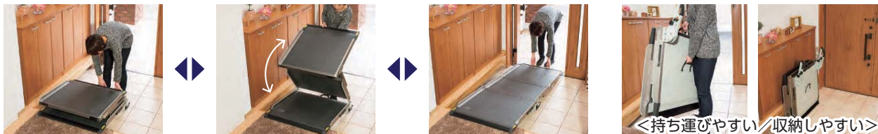
<持ち運びやすい/収納しやすい>

持ちやすい3つの折りたたみ構造なので、設置しやすく、収納しやすく、持ち運びも簡単にできます。