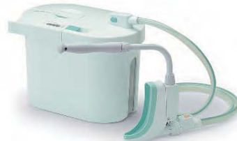
女性用セット (本体+女性用レシーバーセット)