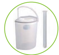
尿タンク・ブラシ入れが 付属します。

省電力で長距離電波を飛ばせる新型 IC を搭載した小型探知器。 探知器(子機)を装着した利用者が、親機から一定距離離れたら、その時点で親機が検知してお知らせ。