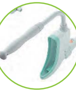
ハンドルが 付属します。