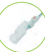
アタッチメントが 付属します。