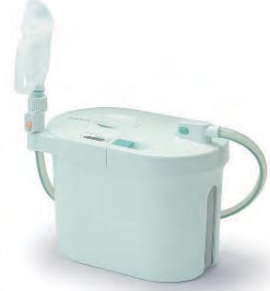
男性用セット (本体+男性用レシーバーセット)