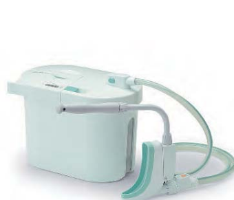
女性用セット (本体+女性用レシーバーセット)