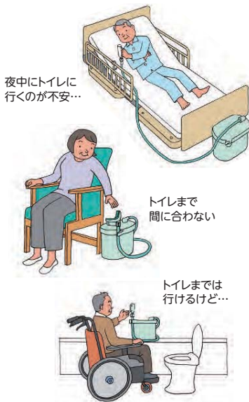
夜中にトイレに行くのが不安...